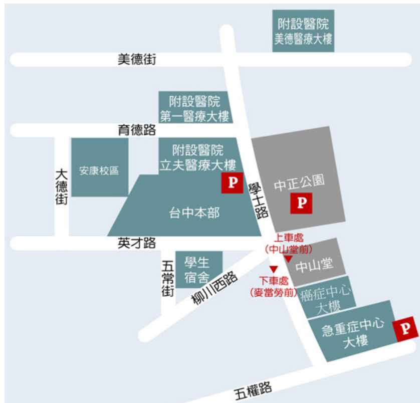
高鐵免費快捷專車-中國醫藥大學站 接駁位置圖 (更多資料請參考： 台灣高鐵轉乘服務資訊 )

97 年 1 月 16 日起高鐵台中站免費接駁專車延伸至本校發車（統聯客運），分別於【台中站 6 號出口 13 號月台】及【學士路「中國醫藥大學」市公車站牌（中山堂前）】上車，車程約 40 分鐘。搭車位置可參考下圖：