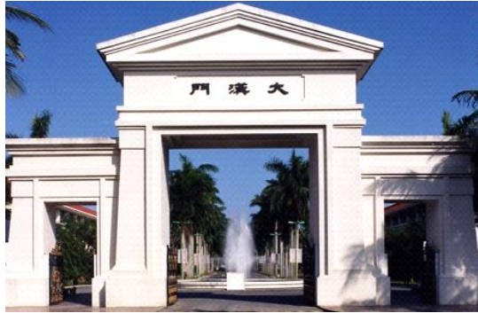
圖 1 大漢技術學院校門