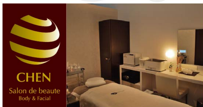
Private Salon 「CHEN Salon de beauté」 SITE http://www.hasegawa-chen.com

除了擔任專業的彩妝講師及經營美容沙龍之外，也為知名的日本藝人及政商名流設計專屬彩妝，並深入日本節目現場為出席藝人化妝，同時擔任日本電視節目的專屬中文翻譯主持人，對促進國際間的交流作最大的努力。